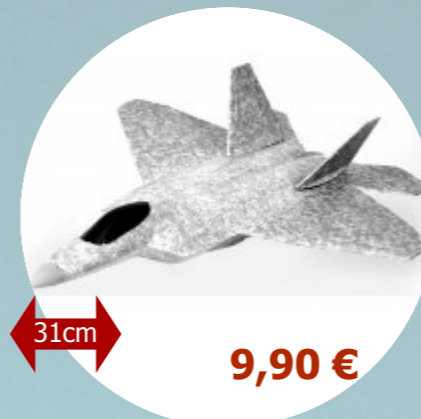
F22 T2M - T4002

Modèle en EPP = Très bonne résistance aux chocs