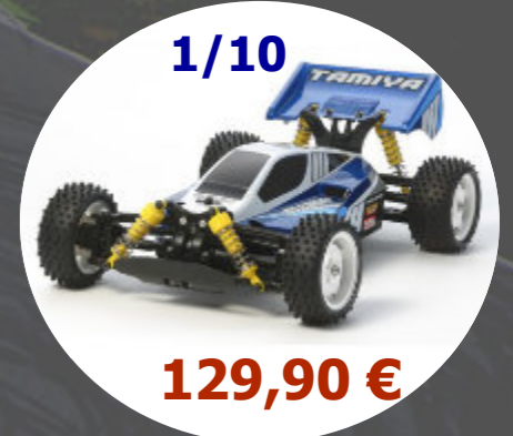
Neo Scorcher - TT02B Tamiya - 58568