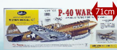
P-40 Warhawk 74,90 € Guillow's - S0280405