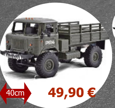
PR4 - 4WD V2 Funtek- FTK-PR4 1/16