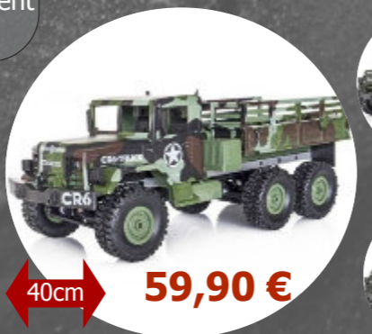
CR6 - 6WD Funtek- FTK-CR6 1/16

Les crawlers sont conçus pour faire du franchissement sur du terrain accidenté. C'est pourquoi ces véhicules prennent peu de vitesse