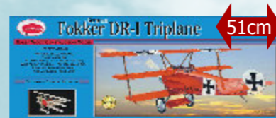
Fokker DR-1 74,90 € Guillow's - S0280204