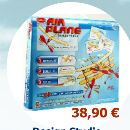
Design Studio Guillow's - S0280141 * Kit vol libre à assembler