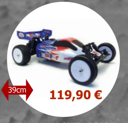
Jumper - 2WD 1/10 MHD - Z6000026 Accu 7,2V