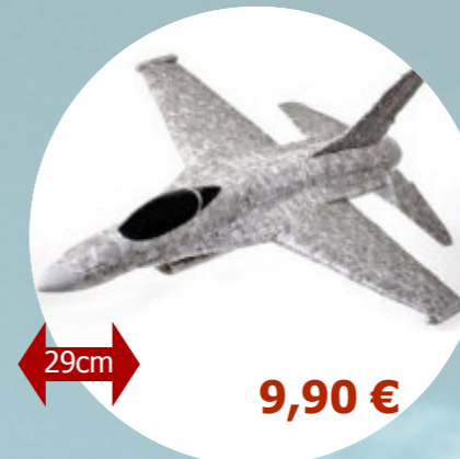
F16 T2M - T4000