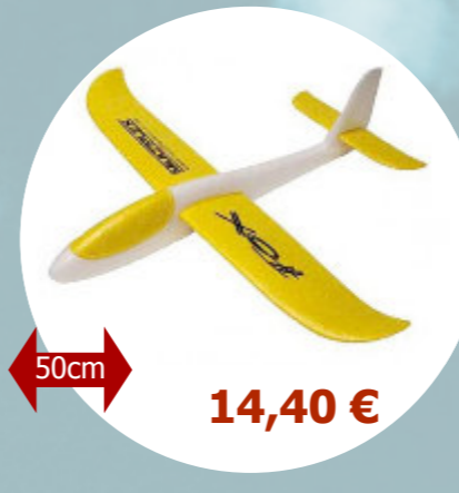
Fox - Jaune Multiplex - 854288