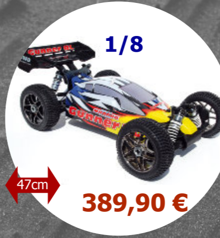
Gunner BL V2 combo Brushless MHD - Z630002 LiPo 3S