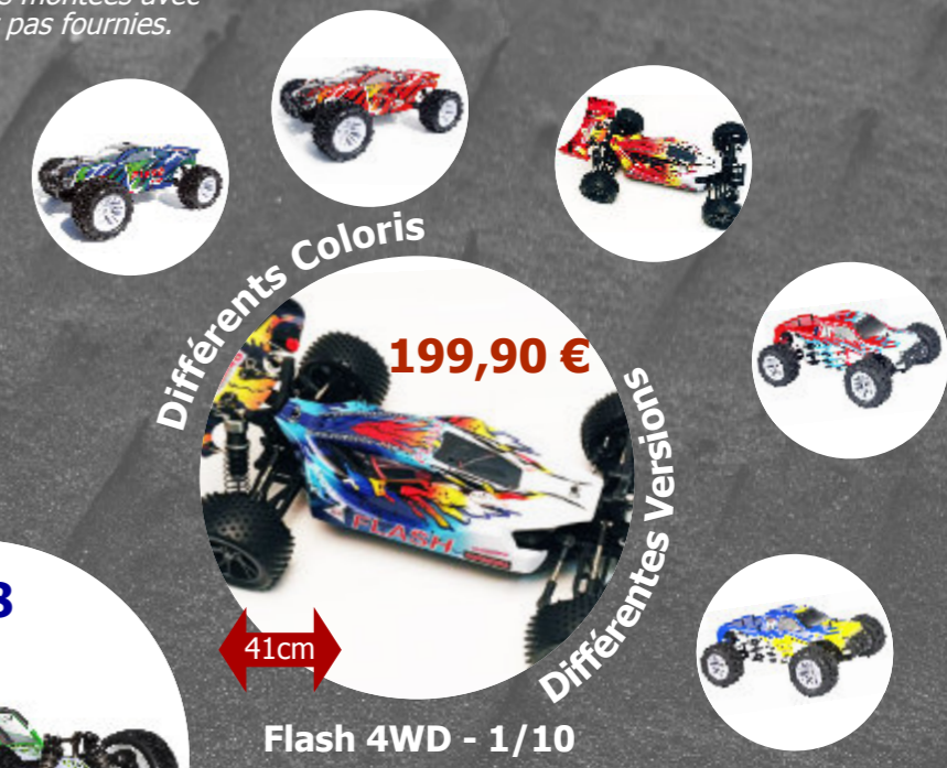
Flash 4WD - 1/10 MHD - Z6000007B Accu 7,2V