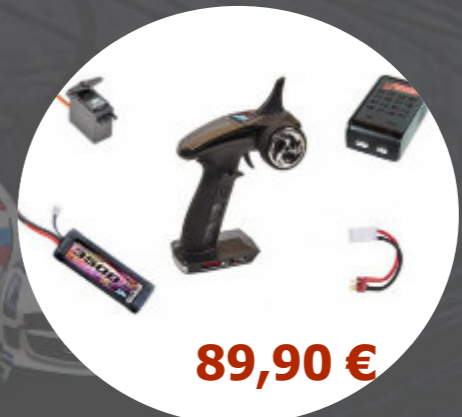
Package LiPo + Radio T2M - T4618L1