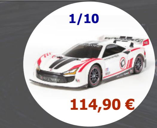
Raikiri GT TT02 Tamiya - 58626