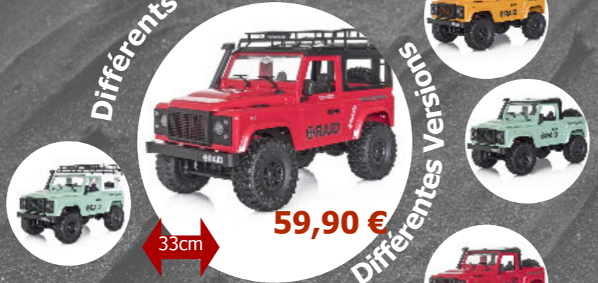
Raid 1 4x4 - 1/12 Funtek - FTK-Raid