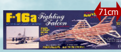
F-16a 32,30 € Guillow's - S0281403