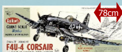
F4U-4 Corsair 109,90 € Guillow's - S0281004