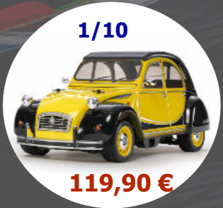
2CV Charleston M-05 Tamiya - 58655