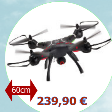
Spyrit EX GPS 3.0 T2M - T5180

Accu supplémentaire : Ref T5181/05 33,00 €