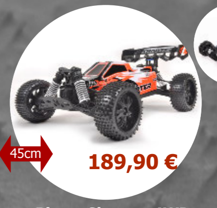
Pirate Shooter 4WD T2M - T4931OR Accu 7,2V