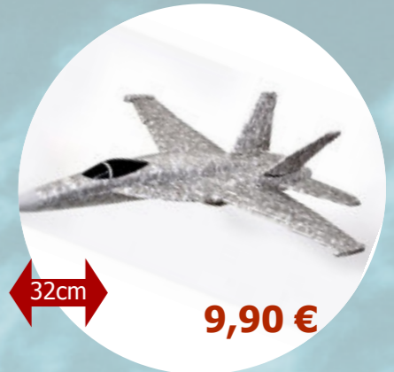
F18 T2M - T4001