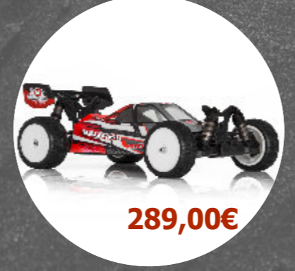
BXR S1 4WD Brushless Hobby Tech - 1.BXR.S1.RTR