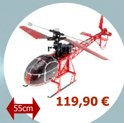
Lama MT250 RTF Siva Toys - MT250