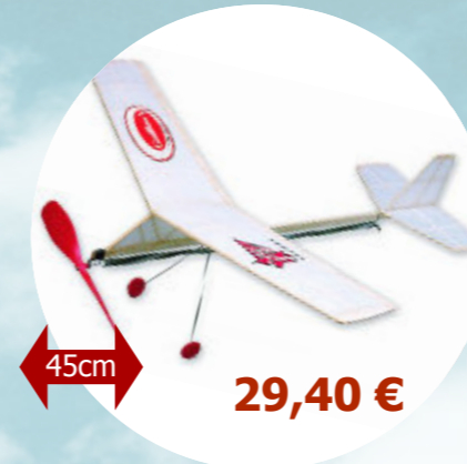
Cloud Buster Guillow's - S0284301 * Kit vol libre à assembler