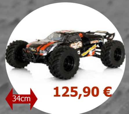
ST4 4x4 - 1/12 Funtek- FTK-ST4