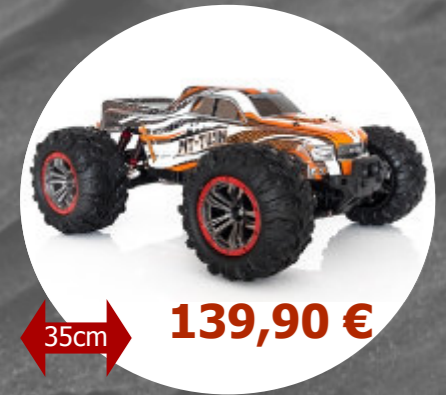
MT Twin 4x4 - 1/10 Funtek- FTK-MT-TWIN