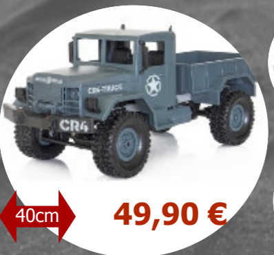
CR4 - 4WD V2 Funtek- FTK-CR4 1/16