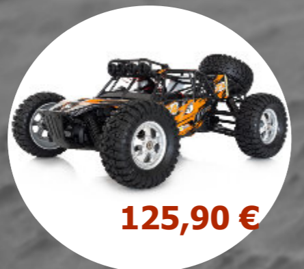
DT4 4x4 - 1/12 Funtek- FTK-DT4