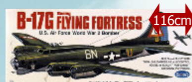
B-17G 149,90 € Guillow's - S0282002