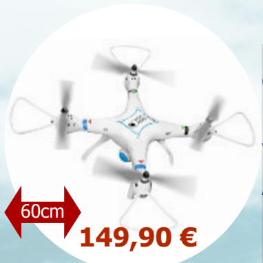
Spyrit EX 3.0 T2M - T5186

Accu supplémentaire : Ref T1308001R 15,90 €