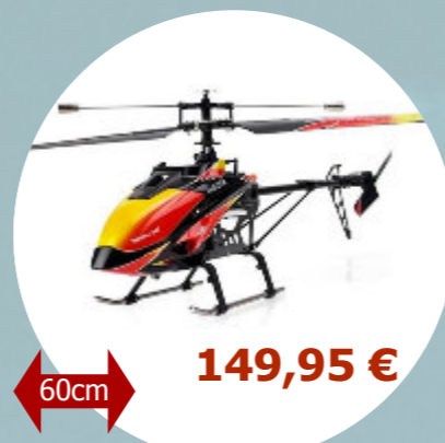
Tiny 530 RTF Brushless MHD - Z705001