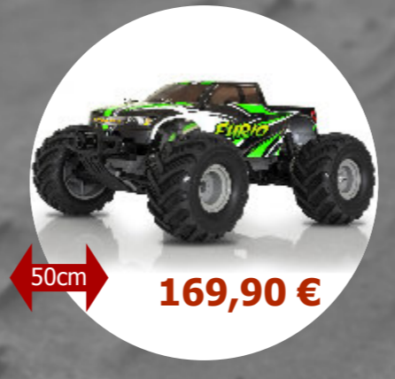
Furio V2 - 2WD 1/10 Funtek - FTK-FURIO-V2 Accu 7,2V