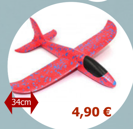
Mini Fidibus 179916