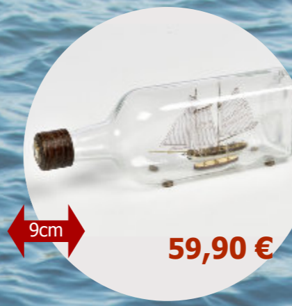
Yacht Olandese Amati - B1350