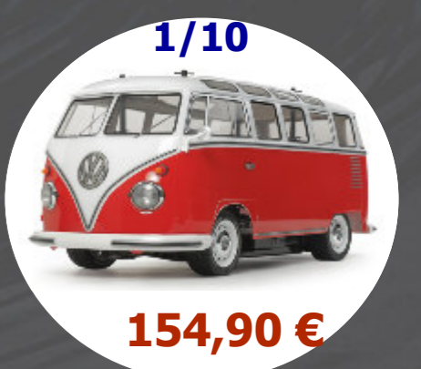
VW Type 2 (T1) - M06L Tamiya - 58668