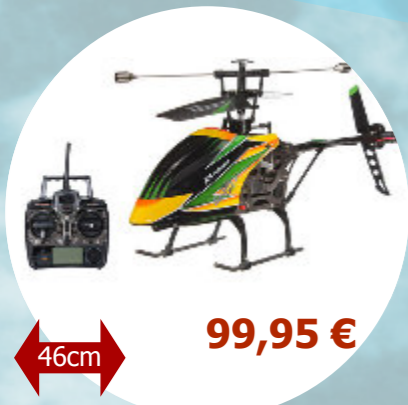
Tiny 400 RTF MHD - Z704001

Leur tolérance et leur stabilité en font des machines idéales pour les débutant. Elles peuvent évoluer en extérieur avec un vent faible.