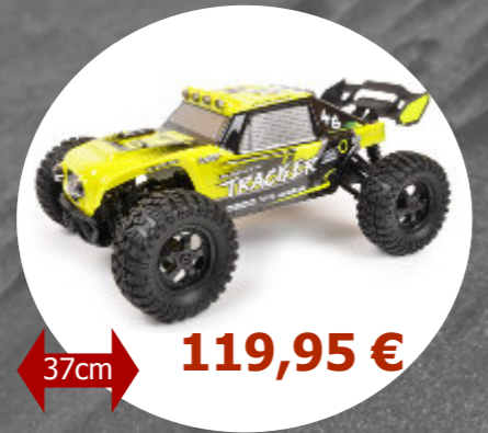
Pirate Tracker 4x4 T2M - T4940 - 1 / 10