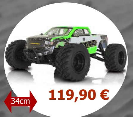
MT4 4x4 - 1/12 Funtek- FTK-MT4