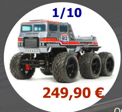
Dynahead 6x6 Tamiya - 58660