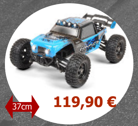
Pirate Ripper 4x4 T2M - T4946 - 1 / 10