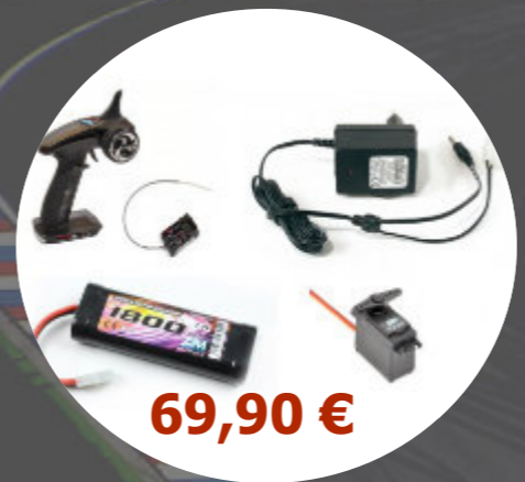
Package NiMh + Radio T2M - LotTamiya

Un kit à monter, est un véhicule livré sous la forme de plusieurs pièces qu'il faut assembler. Généralement, la radio, les servos, les accus et chargeur ne sont pas livrés avec et doivent être achetés séparément, ce qui permet de choisir exactement ce que l'on souhaite. Très souvent, la carrosserie est livrée non peinte. Il faut donc aussi prévoir la peinture