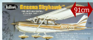
Cessna Skyhawk 91,20 € Guillow's - S0280802