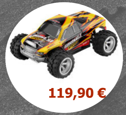
Mini MHD Truggy 4WD MHD- Z837902 - 1 / 18