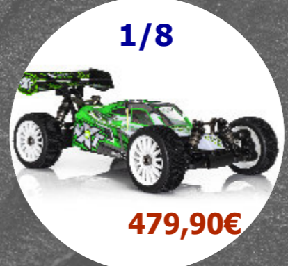
NXT EP 4WD Brushless Hobby Tech - 1.NXT.EP-2.0 *A prévoir LiPo 4S ou 2 packs 3S + chargeur