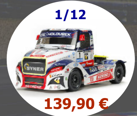
Buggyra Racing Fat Fox - TT01E Tamiya - 58661