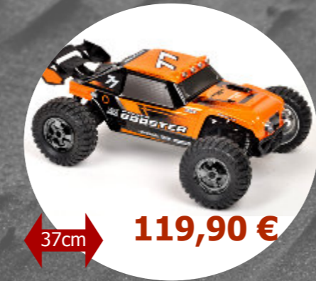
Pirate Booster 4x4 T2M - T4933 - 1 / 10