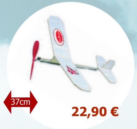
Cadet Guillow's - S0284201 * Kit vol libre à assembler

* Kit de vol libre à assembler : Il s'agit de kit simple, constitué d'un nombre réduit de pièces en Balsa , permettant de découvrir le plaisir de la construction.